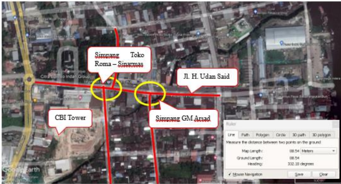
Gambar 2. Lokasi Penelitian