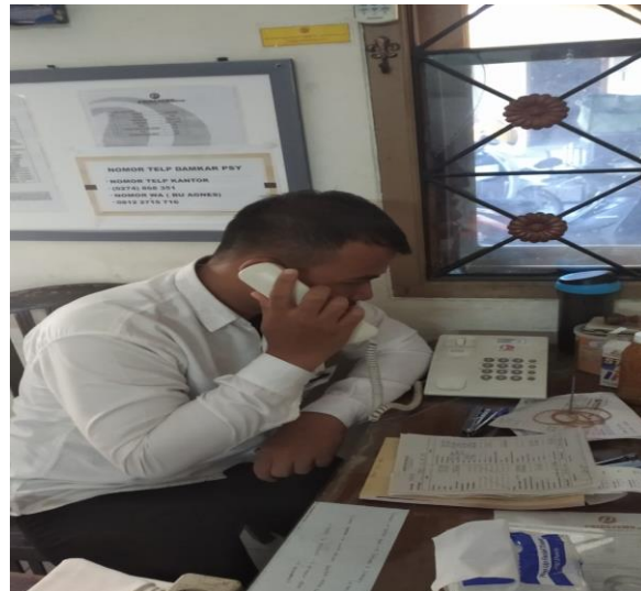
Gambar 3 Proses komunikasi dengan pihak