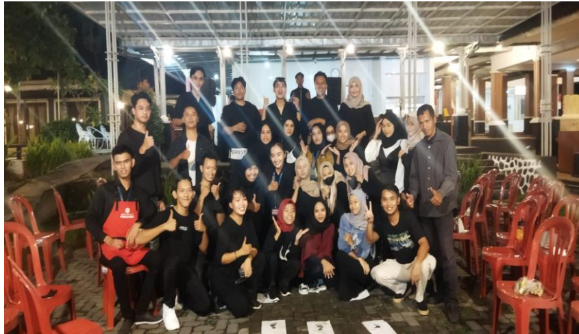
Gambar 1 Kegiatan di Pringsewu

juga bagaimana melakukan perencanaan baik dalam pengengadaan event promosi yang dilakukan mulai dari menetapkan anggaran hingga menghitung biaya promosi yang akan dikeluarkan serta target hasil yang akan diperoleh dalam melakukan promosi sehingga pengeluaran biaya yang dikeluarkan restoran tidak sia-sia dan mampu mendapatkan target yang sudah ditetapkan.