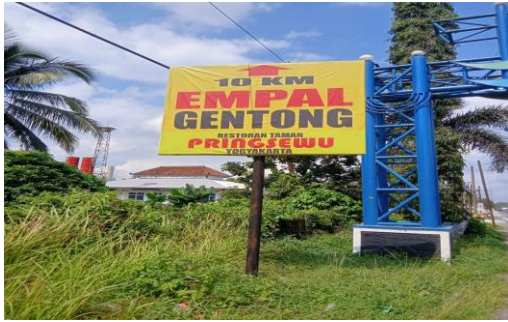
Gambar 4 Road Sign Pringsewu