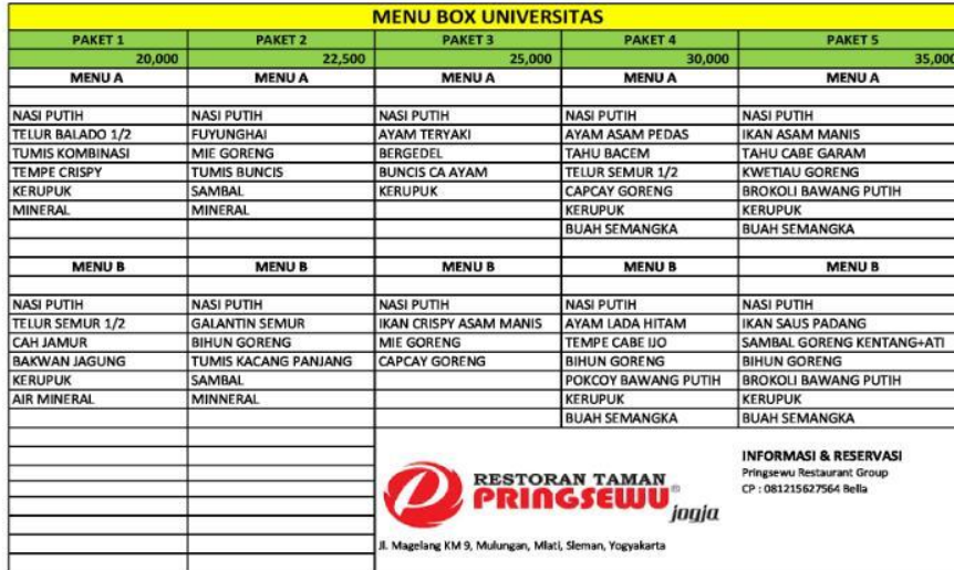
Gambar 2 Menu khusus promosi untuk Universitas/Kampus