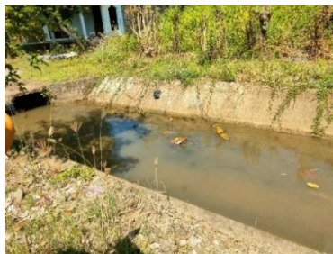
Sumber: Dokumen pribadi

Sedimentasi pada B.Am 4 (1303 m s/d 2041 m) perlu dilakukan pengerukan menggunakan alat berat. Pengerukan dengan alat berat pada B.Am 4 (1303 m s/d 2041) karena sedimentasi sepanjang 738 m ini sudah dangkal dan saluran terletak pada area pemukiman yang memungkinkan penggunaan alat berat.